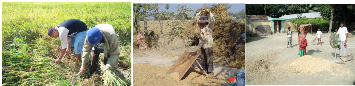
ការច្រូត បោក និង ការរោយសម្អាតស្រូវដោយដៃ

ទាំងអស់នេះរួមមានការប្រើប្រាស់ឧបករណ៍បុរាណសំរាប់បោក ដូចជា : ការបោកដោយឧបករណ៍បោកធាក់ជើង និងការបញ្ជាន់ដោយសត្វពាហនៈ ជាដើម ។