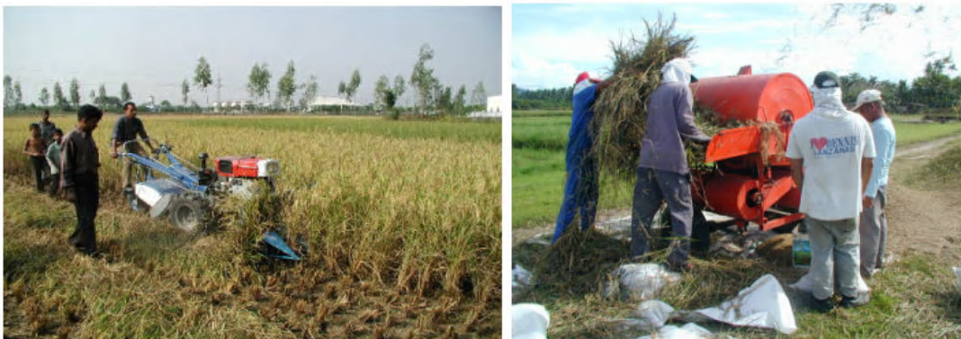
ការច្រូតស្រូវដោយគោយន្ត និង ការបោកដោយម៉ាស៊ីន

ការច្រូតកាត់ត្រូវធ្វើដោយម៉ាស៊ីនច្រូតចុះតូច( គោយន្ត) ដែលវាគ្រាន់តែកាត់ដើមស្រូវរួចកៀរស្រូវដែលកាត់ ហើយទៅតំរៀបជាជួរនៅផ្នែកម្ខាងនៃម៉ាស៊ីន ។ បន្ទាប់មកទើបប្រមូលវាយកទៅបោកដោយម៉ាស៊ីនបោក និង សម្អាត ដោយដៃ ឬ ដោយម៉ាស៊ីនសម្អាត ។