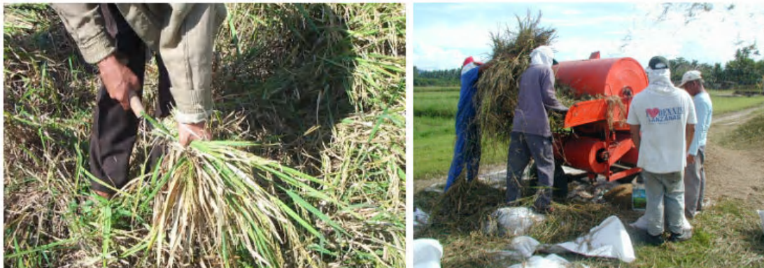
ការច្រូតស្រូវដោយដៃ(កណ្តៀវ) និង ការបោកស្រូវដោយម៉ាស៊ីន